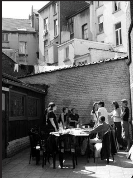
Juin 2003 Bruxelles

À tel point que l'équipe d'encadrement a convenu, en cours de session, de recadrer davantage les choses. L'alternance entre les moments didactiques et les exercices