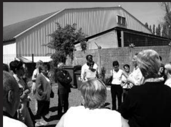
Mai 2002 Haubourdin Visiter, expliquer, parler dans l'espace public

Le dernier travail, celui du "4 pages", a été pour moi le plus révélateur. Il s'agissait d'expliquer, le plus simplement possible, ce que l'on fait. J'ai pris conscience de ce malaise qui s'accumulait, ce sentiment d'avoir "le nez dans le guidon", de ne pas avoir de recul, de temps pour impulser de la créativité, pour donner vraiment une place aux habitants, outre d'exécuter la demande immédiate des élus.