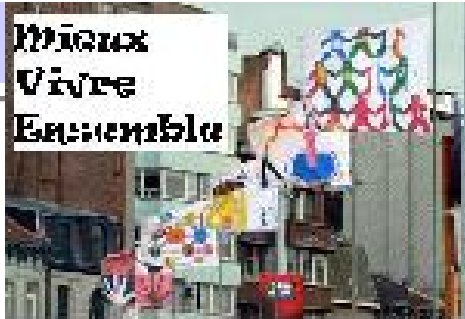
à Glain-Burenville !